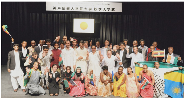
神戸情報大学院大学秋季入学式

この一行は神戸情報大学院大学で学んでいる学生です。この大学はICT（情報通信技術）を使って途上国の社会課題解決を専門的に行う、世界的にもユニークな専門職修士課程「ICTイノベータコース」を開設しています。このコースの主な受講者は、外務省や文部科学省を通じて募集されたアジアやアフリカ各国の将来を担う行政官や産業人材であり、課程終了後は本国において社会課題開発現場での活躍が期待されています。彼らは将来の自国の発展に寄与するという高い目的意識と情熱を持って日本で学んでいます。