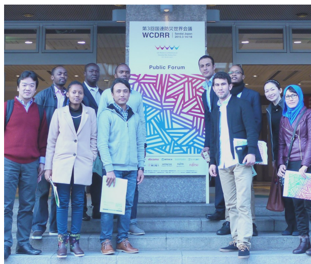
世界市民防災会議(仙台)に参加