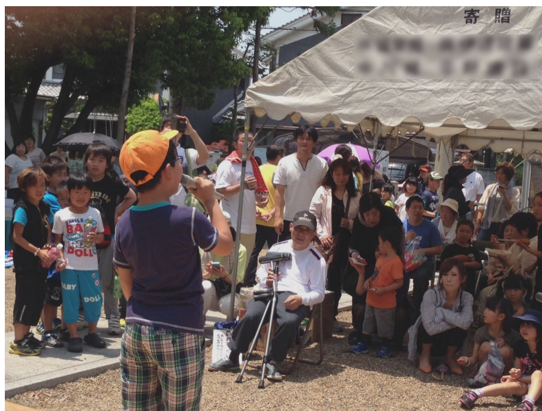
メイクるタウンフリーマーケットの様子